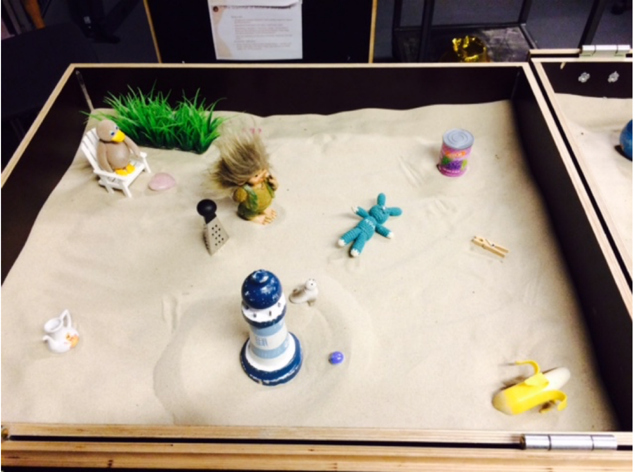
Figurostilling i sandkassen af Fyrtårnsdialogen under workshop i Material story lab i E2015

Material story lab var i 2015 tovholder på et aktionsforskningsprojekt ved Ældre- og Handicapforvaltningen ved Aalborg Kommune, som handlede om at styrke samarbejdet på tværs af Myndighed og Udfører-ledet i de 5 specialområder som handicapområdet er opdelt i. Resultatet blev udviklingen af en samarbejdsmodel benævnt 'Fyrtårnsmodellen'.