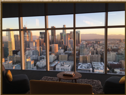
Immersive Theatre LA, BigSTORY