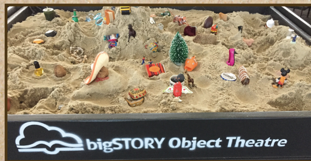
Pulling stories out of Earth, LA BigSTORY