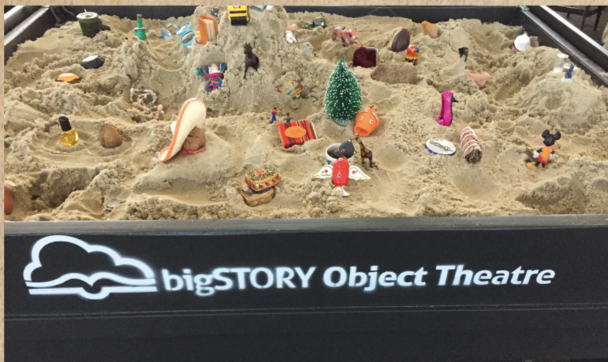
Figur 1: Foto fra konference i LA i Dec 2015 hvor jeg deltog med Material Story Lab metoden 'Object Theatre'

For uddybende og eksemplificerende materiale om netværksplatformen Material Story Lab se www.materialstorylab.com